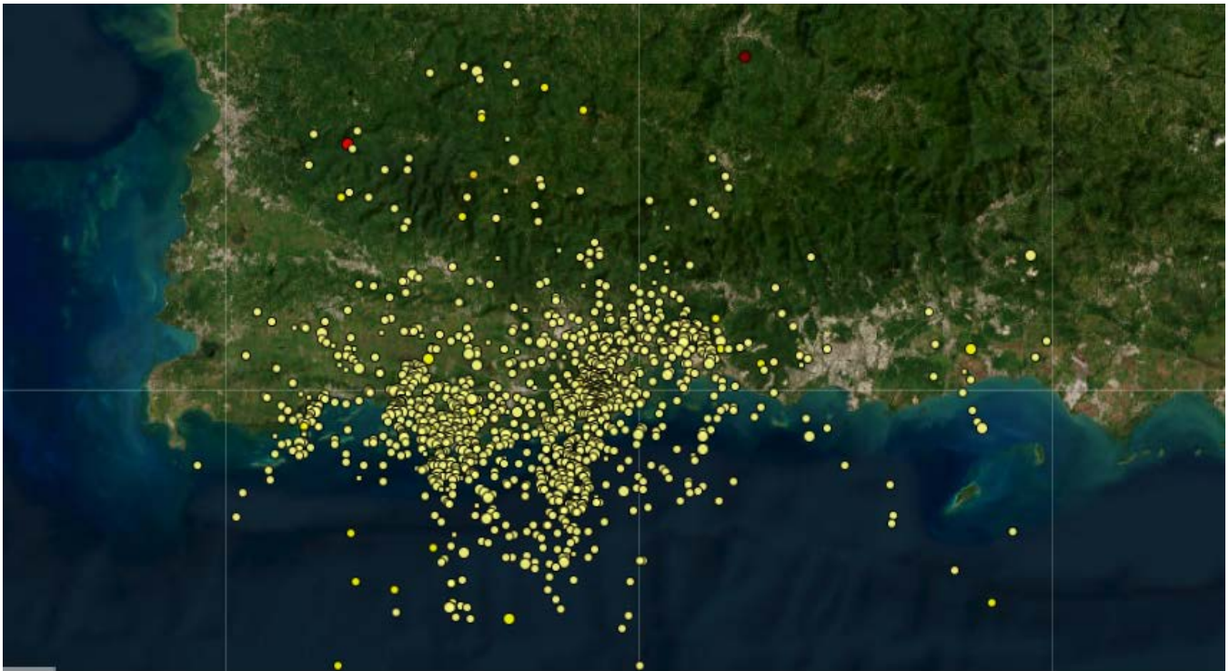
Figura 2. Mapa epicentral de los sismos localizados de la Secuencia Sísmica del Sur-Suroeste de Puerto Rico en el 2024 (RSPR-UPRM).

Durante el 2024 continuó la actividad de réplicas de la secuencia sísmica (S) del Sur-Suroeste Puerto Rico. La secuencia sísmica del Sur-Suroeste de Puerto Rico comenzó el 28 de diciembre de 2019 con un temblor de magnitud 4.7 MI. El evento principal de esta secuencia ocurrió el 7 de enero de 2020 en la Región Sur de Puerto Rico a 12.7 km al Sur de Guayanilla y tuvo una magnitud de 6.4 Mww. Este temblor fuerte, con profundidad de 7 km, tuvo una intensidad máxima de VIII en Guánica, Puerto Rico y produjo daños mayores a través de Puerto Rico. Desde el comienzo de la secuencia sísmica del Sur-Suroeste de Puerto Rico en 2019 hasta abril de 2024, se han procesado 27,497 temblores asociados a la misma (figura 2). Se han localizado más de 1,688 sismos sentidos de esta secuencia y más de 492 eventos significativos de magnitudes mayores de 3.5 . De estos, un total de 42 sismos han sido de magnitudes mayores a 4.5 . Para más información de la sismicidad en la Región de Puerto Rico y las Islas Vírgenes visite redsismica.uprm.edu , o comuníquese con la Red Sísmica de Puerto Rico al 787-833-8433.